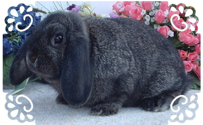
beste 0,1 JTS 2010