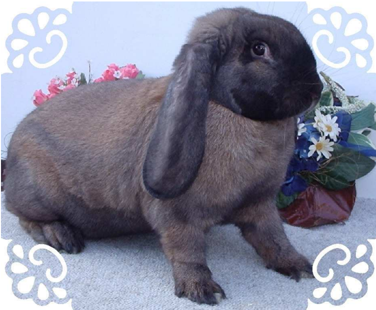
besten 1,0 JTS 2010